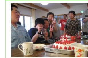
手作りケーキで誕生会