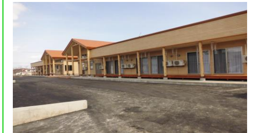
さくら草(グループホーム) 弘前市大字独狐松ヶ沢20-5