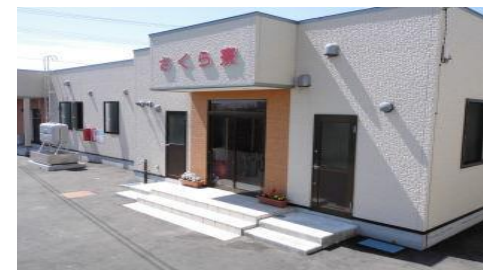
さくら寮(グループホーム) 弘前市大字独狐字山辺197-1