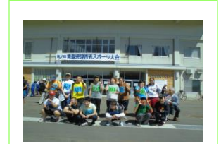
障害者スポーツ大会参加