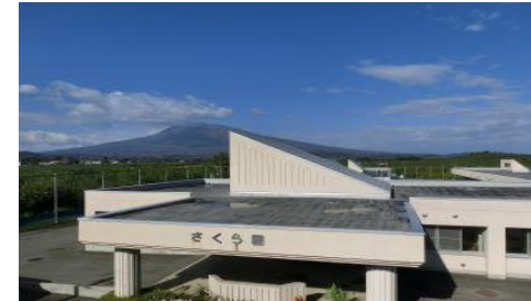
障害者支援施設 さくら園 弘前市大字独狐字山辺183