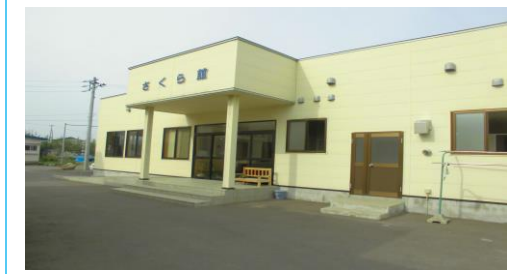
サポートセンターさくら(就労継続支援B) 弘前市大字独狐字山辺183