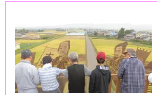
田んぼアート見学